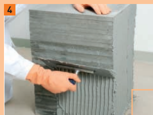
4 La colle est appliquée sur la tranche des plaques