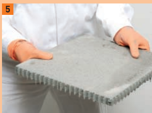
5 La colle se pose sur les deux côtés des plaques empilées à l'aide d'une spatule dentée de 6 mm