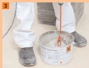
3 ...et mélangées avec un malaxeur