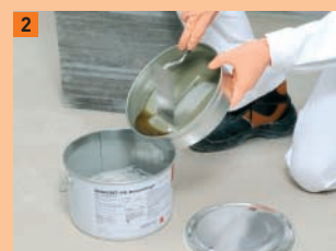
2 Les deux composantes de la colle sont assemblées...