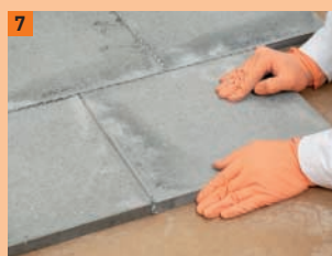
7 Les plaques sont calées l'une contre l'autre (largeur de joint env. 1 à 1,5 mm)