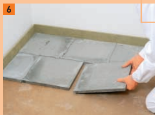
6 Les plaques Powerpanel SE se posent en quinconce, de façon à éviter les chutes inutiles