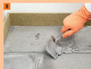
8 Les surplus de colle sont récupérés à l'aide d'une spatule et réemployés